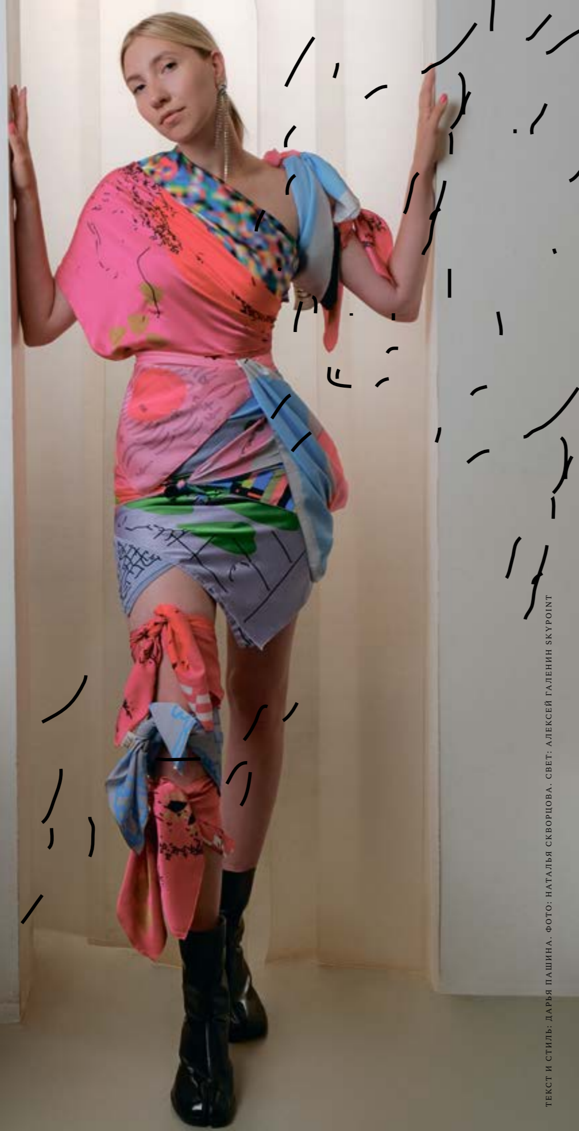
ТЕКСТ И СТИЛЬ: ДАРЬЯ ПАШИНА. ФОТО: НАТАЛЬЯ СКВОРЦОВА. СВЕТ: АЛЕКСЕЙ ГАЛЕНИН SKURPOINT

Расспросили дизайнера Ольгу Кулиш, когда ждать новые дропы и причем здесь кофейня Lu.Co и бюро Akme Works.