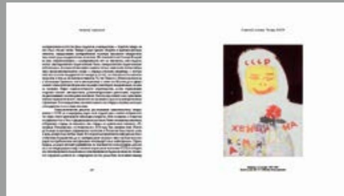
Георгий Гурьянов. «Женщина — космонавт». 1985–1988. Бумага, гуашь. 42 × 30. Собрание семьи Георгия Гурьянова