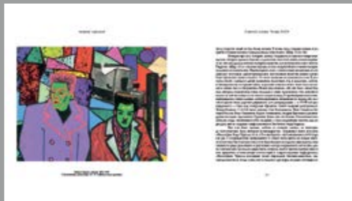
Георгий Гурьянов. «Портрет Тимура и Шутова». 1985–1988. Ч/б фотография, фломастеры. 15 × 19. Собрание семьи Георгия Гурьянова