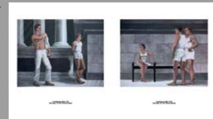
Георгий Гурьянов. «Строгий юноша». Диптих. 1994. Холст, акрил. 170 × 250. Частная коллекция