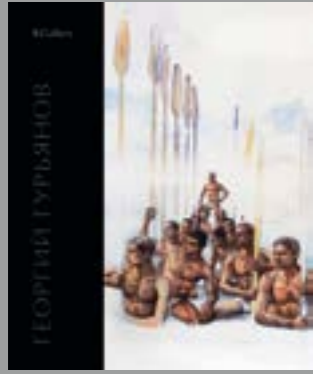
Книга Ипполитова «Георгий Гурьянов» выходит в издательстве KGALLERY.