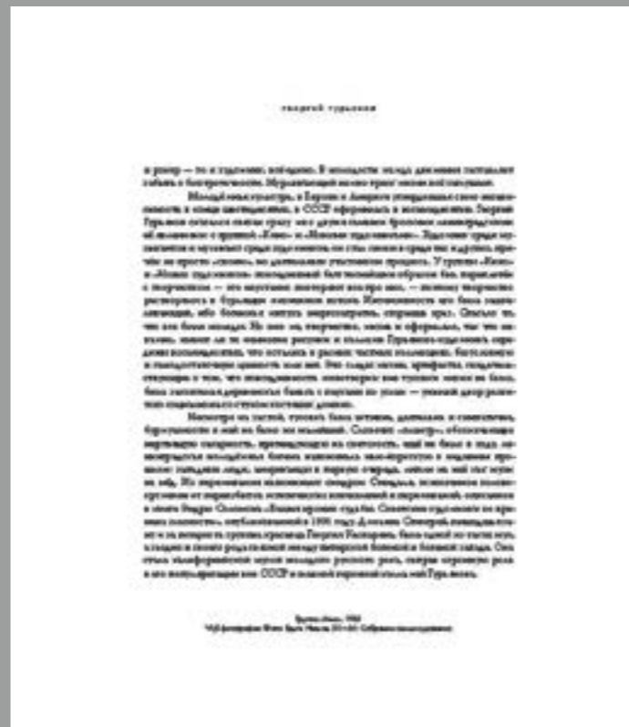
Едыге Ниязов. «Группа "Кино"». 1985. Ч/б фотография. 50 × 60. Собрание семьи Георгия Гурьянова