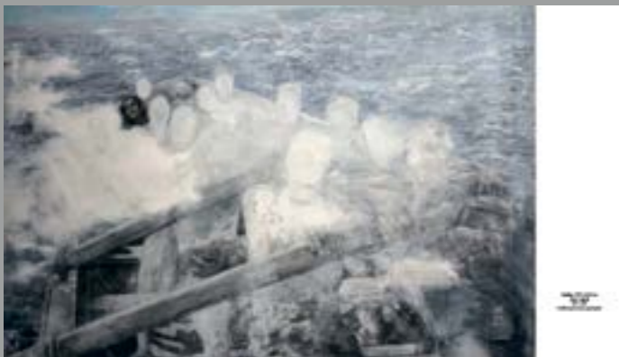
Георгий Гурьянов. «Без названия». 2000-е. Холст, акрил. 118 × 159,5. Собрание семьи Георгия Гурьянова