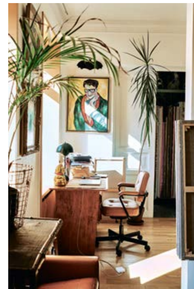
Вид на кабинет и хранилище картин. На стене — портрет Ива Сен-Лорана работы Сергея Бондарева и арт-объект из резины «Летучая мышь» работы Дениса Прасолова