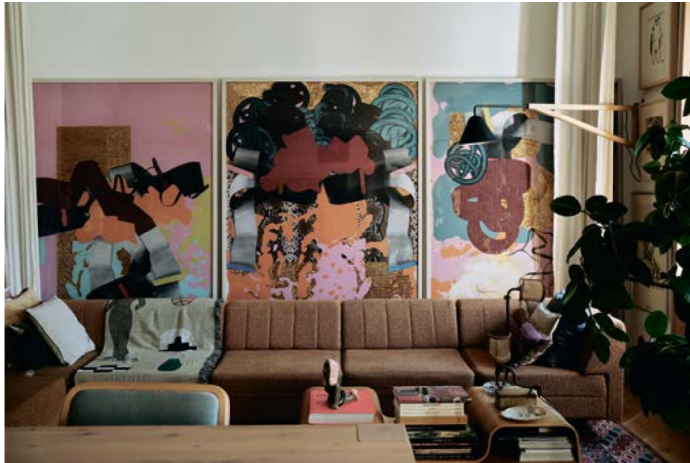
В гостиной: триптих «Змеи» Сергея Бондарева (2016)