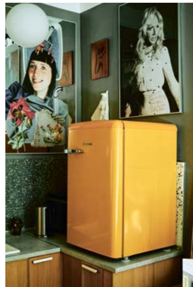
Кухня в гостевой зоне: фотография Вада Мамышева-Монро и взгромоздившийся на кухонный стол холодильник