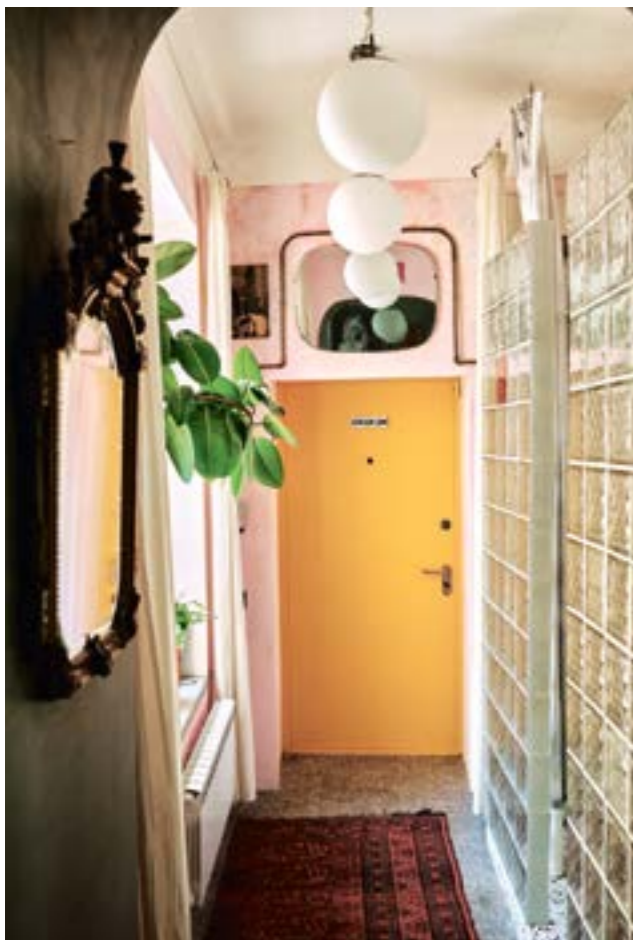
Черный ход с желтой дверью в гостевой зоне квартиры