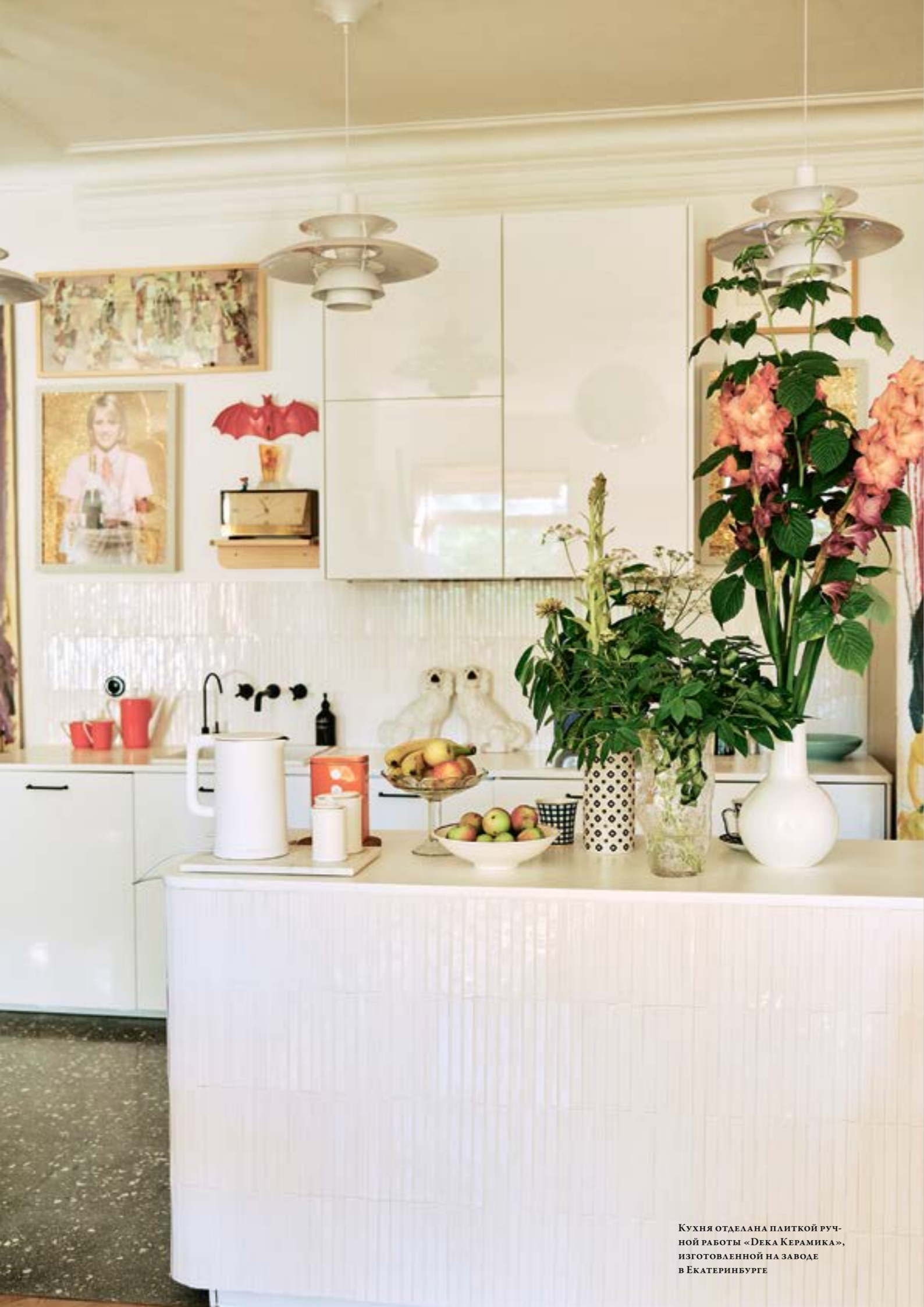
Кухня отделана плиткой ручной работы «Дека Керамика», изготовленной на заводе в Екатеринбурге