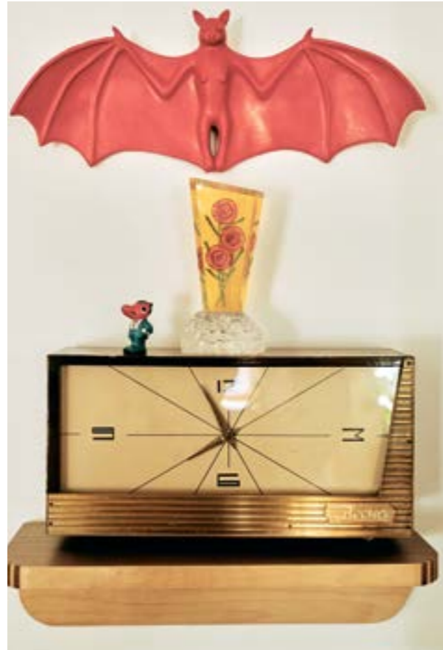
Летучая мышь из резины Дениса Прасолова и советские часы mid-century