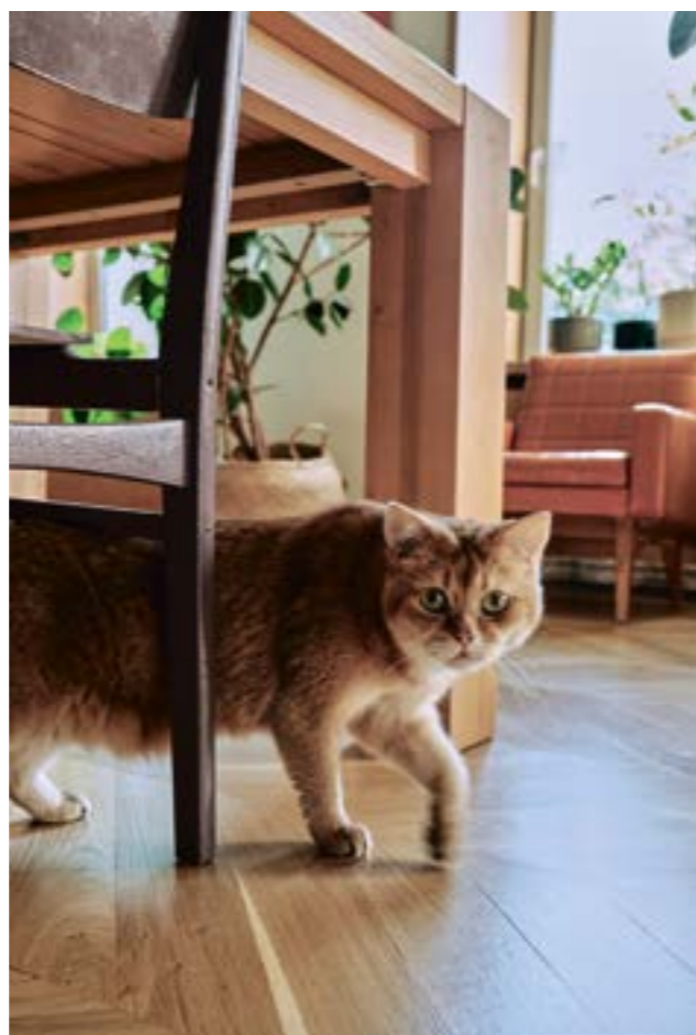
Кот Капитон крадется