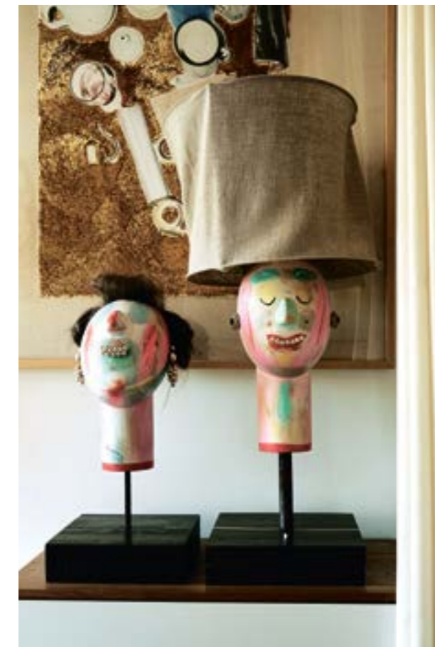
Объекты из дерева работы Сергея Бондарева