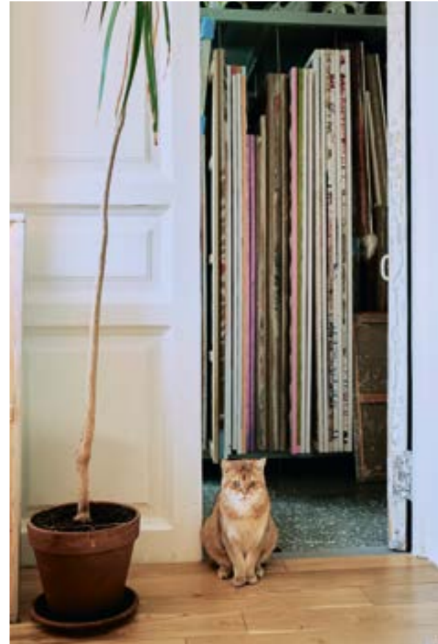
Кот Капитон на входе в хранилище картин