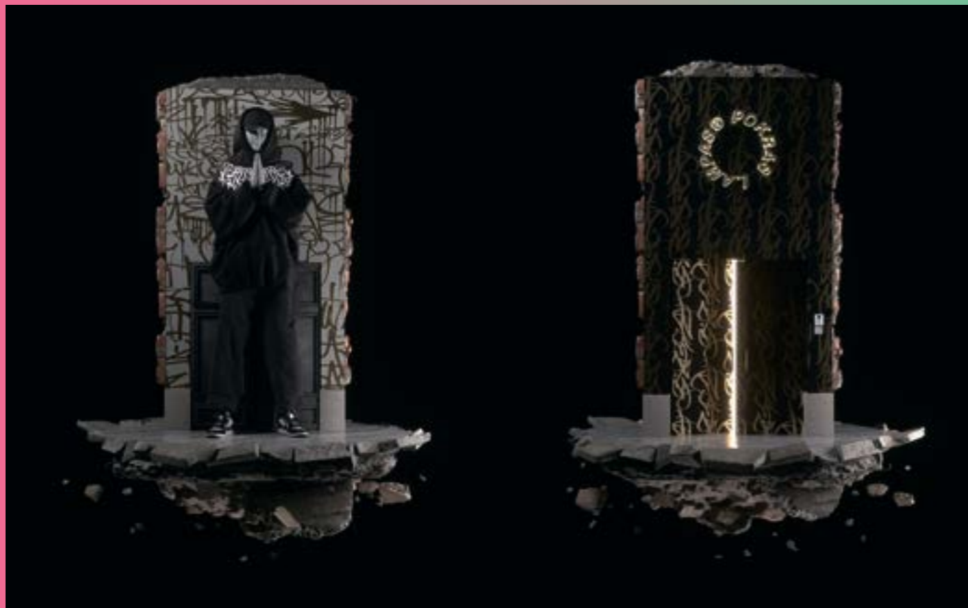
ПОКРАС ЛАМПАС УЖЕ В МЕТАВСЕЛЕННОЙ — АВАТАРЫ ИЗ НОВОГО ПРОЕКТА. РЕЛИЗ — ЭТОЙ ОСЕНЬЮ

Текст: Ксения Гощицкая