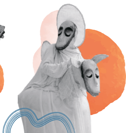
Гастроли театра «Странствующие куклы господина Пэжо»