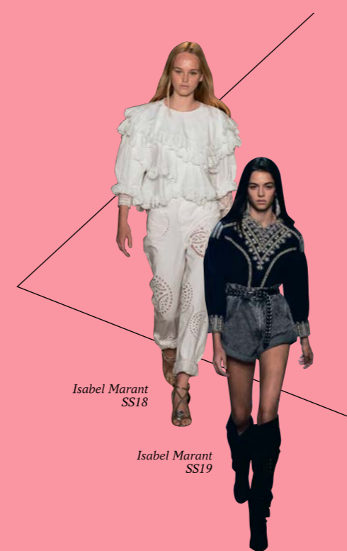
Isabel Marant SS18