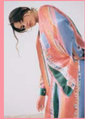
Шелковая пижама Weekend в принте Casablanca

все вместе соединилось: море, друзья, веселье и домашняя одежда. Это еще откуда-то из детства: мы жили на площади Тургенева, и у нас была однокомнатная квартира — такая царская, с камином, которая была постоянно переполнена народом. Я там сидела (в пижаме!) и пыталась учиться, а вокруг были тусовки, вечеринки, кто-то на гитаре играл. Мне очень важно, помимо качества и прикольного продукта, нести настроение.