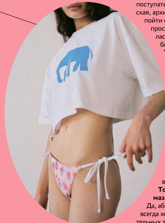
Футболка со слонем и бикини в принте Leo

Чудаки повзрослели, да. И ходят везде в смешных пижамах.